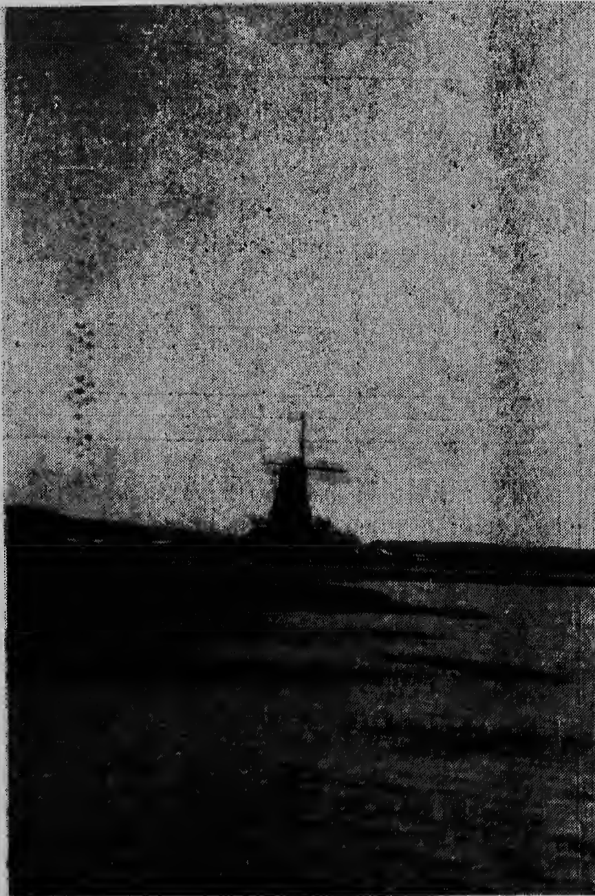
Mirando „De Olde Molen“ parti dilanti e ta duna un berdadero aspecto Hulandes. Como na Hulanda tin asina tantu mulina kantu di awa, de la manera pa hendenan cu conoce Hulanda sabi cu mulina y awa ta pertenece banda di otro.

Ainda ta dos piso e mulina tin. Quen cu subi ariba via e trapi anchu, ta hanja riba e prome piso un restaurant de lo mas dibertido i ordent, foi unda bo por bai mas ariba. Bo ta alcanza e ora ei den un espacio poco mas chiquito, djes bao dje asnan di mulina i tur loque ta pertenece na esei. Aunke solamente per dal bitter. Riba e piso aqui nos ta hanja e porta na